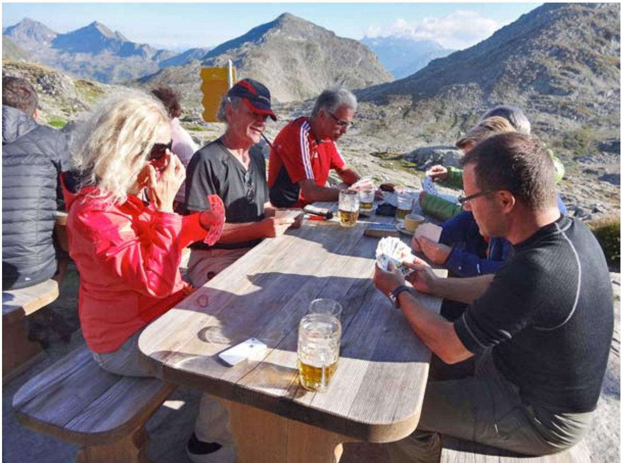
Sie klopfen einen Jass bei Bier etc.

Und was machen die BerggängerInnen, wenn sie sich am Panorama satt gesehen haben?