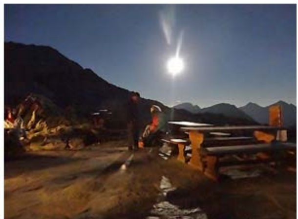
Unvergessliche Impressionen in der Vollmond-Nacht vom 29. auf den 30. August 2015