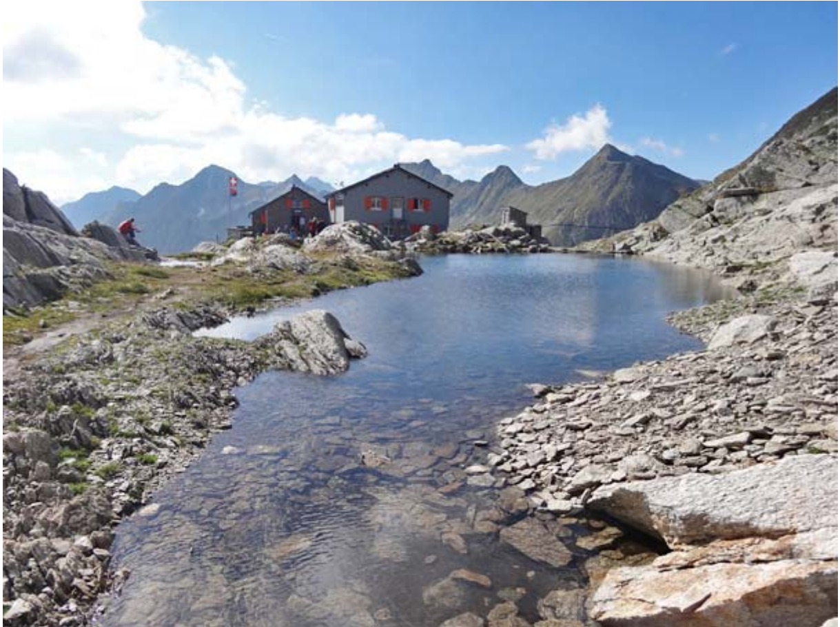
Alpen Whirlpool auf über 2500 m Höhe ;-)

Um 14:20 Uhr erreichen wir die Capanna Cadlimo , unser schön gelegenes Ziel des ersten Tags: